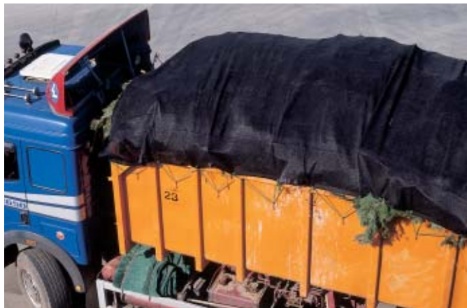
Nr 760-06 z gumową linką napinającą (patrz str.16)