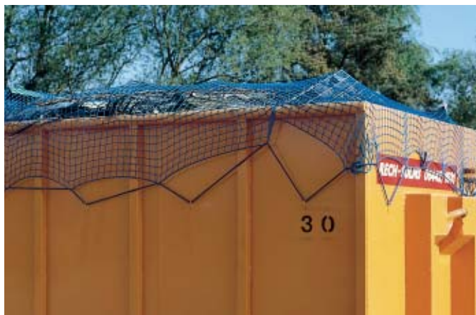
Nr 209-045-04 z gumową linką napinającą (patrz str. 16)