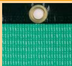
Nr 785-01 Zielony, PP, 550 g/m 2