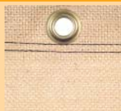
Nr 795-08 Naturalny, Materiał jutowy, 450 g/m 2