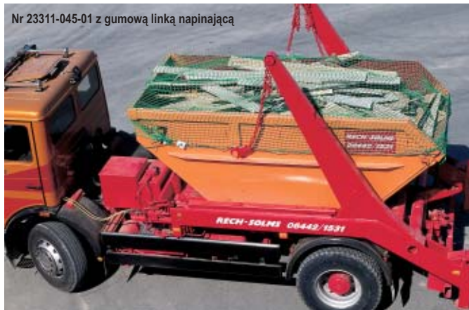
Nr 23311-045-01 z gumową linką napinającą

Siatki na kontenery w standardowych wymiarach, szerokość 3 m z gumową linką napinającą