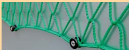
Siatki ochronne o heksagonalnym oczku obszyte elastyczną nicią po obwodzie.

Siatki ochronne na kontenery w dowolnych wymiarach, różna średnica linki i wielkość oczka, patrz str. 5.