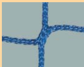
Nr 209 Polipropylen o dużej wytrzymałości, bezwęzłowy, średnica linki 3 mm, niebieski