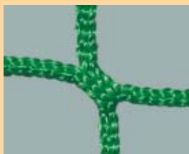
Nr 215 Polipropylen o dużej wytrzymałości, bezwęzłowy, średnica linki 4 mm, zielony