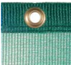
Nr 7201-015 Ciemnozielony, PE, 200 g/m 2