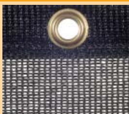
Polietylen, 240 g/m 2