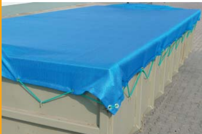
Nr 77536-04 z gumową linką napinającą

Inne produkty do zabezpieczenia ładunków patrz str. 16.