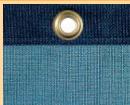
Nr 77531-04 Niebieski, PE, 320 g/m 2