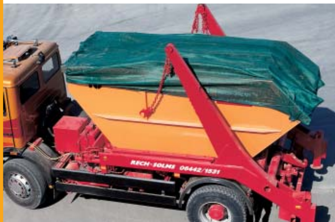
Nr 7201-015 z linką napinającą (patrz str. 16)

Przepuszczająca powietrze tkanina chroni plandeki przed wybrzuszeniem na silnym wietrze lub podczas transportu.