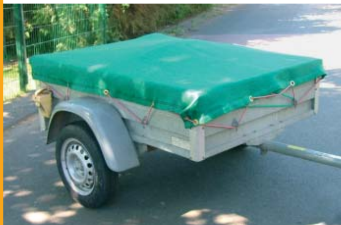
Nr 7218-015 z linką napinającą

Wszystkie siatki na tej stronie są w komplecie z 6 mm gumową linką napinającą!