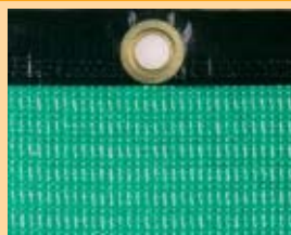
Nr 7851-01 Zielony, PP, 550 g/m 2