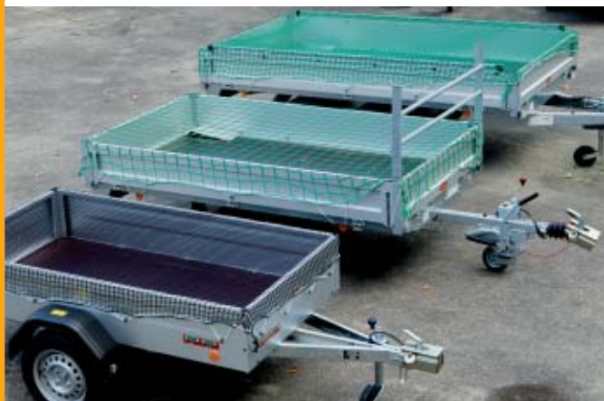
Siatki ochronne na przyczepy. Różne rozmiary i grubości linki

Wszystkie siatki na tej stronie są w komplecie z 6 mm gumową linką napinającą!