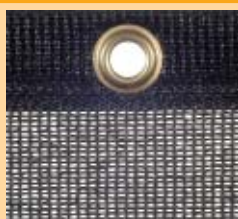
Nr 760-06 Czarny, PE, 240 g/m 2

Siatki metalowe do ładunków specjalnych (żłom, gruz, itp.) dostępne na zapytanie.