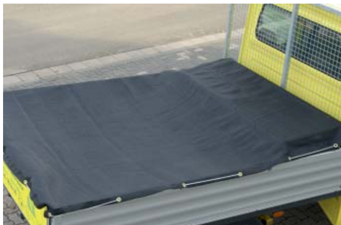
Nr 7667-06 z gumową linką napinającą

Plandeki na ciężarówce w standardowych wymiarach z przepuszczającego powietrze tworzywa sztucznego z linką napinającą.