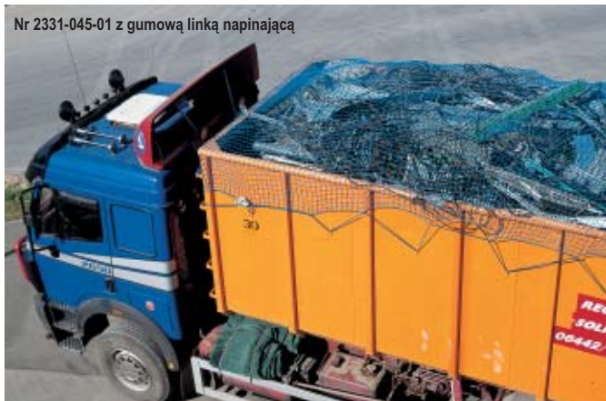
Nr 2331-045-01 z gumową linką napinającą