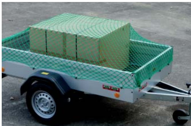
Nr 2541-045-01 o oczku heksagonalnym