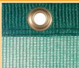
Polietylen, 200 g/m 2