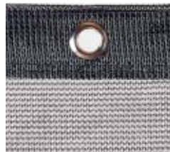
Nr.7701-06 Czarny, Polietylen monofilament, 180 g/m 2

Dostarczana na metry: szerokość 3.5 m, każda długość