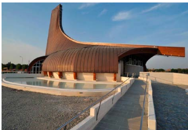
▲ Kościół Świętego Franciszka z Asyżu – Imola Włochy