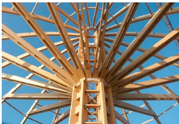
▲ Centrum Handlowe – Bergamo Włochy