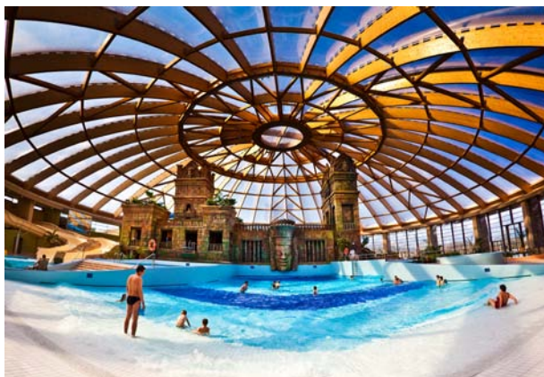
▲ Aquaworld – Budapeszt (Węgry)

ul. Gliwicka 16, 44-200 Rybnik tel. 32 42 30 990, faks 32 42 35 065 www.rubner.pl e-mail: biuro@rubner.pl